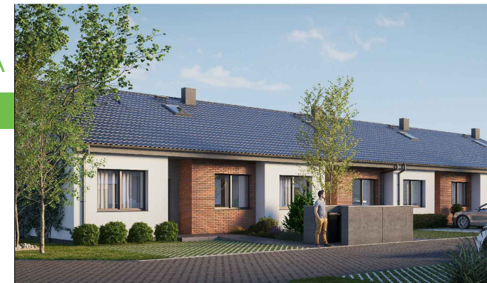
wizualizacja ma charakter poglądowy