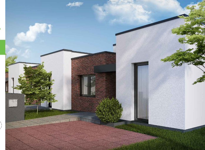
segment środkowy 2B